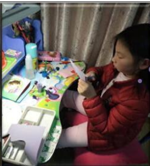
图二：我设计一朵紫色的小花