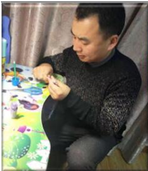
图一：爸爸设计一个小红心