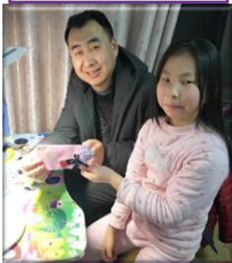
图三：我们一起完成的成品